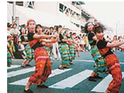
おんまくの前身バリ祭 (1993年～1997年)