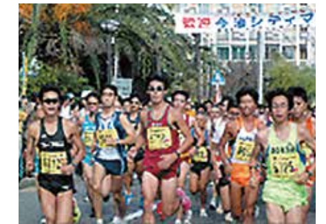
今治シティマラソン (1986年～)