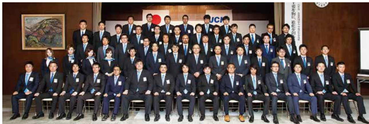
創立50周年 現役メンバー集合写真(2016年度)