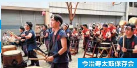
今治寿太鼓保存会

今治青年会議所では、仲間と楽しむクラブ活動を行っています。 スポーツや文化などの多彩な活動を通じて絆を深めています。