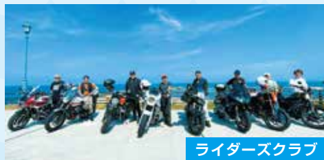
ライダーズクラブ