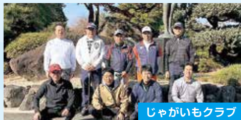
じゃがいもクラブ